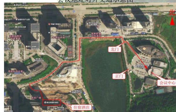
住宿酒店至贵阳院会议中心步行路线示意图(约700米)