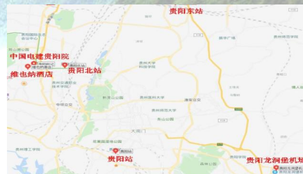
会议地址对外交通示意图